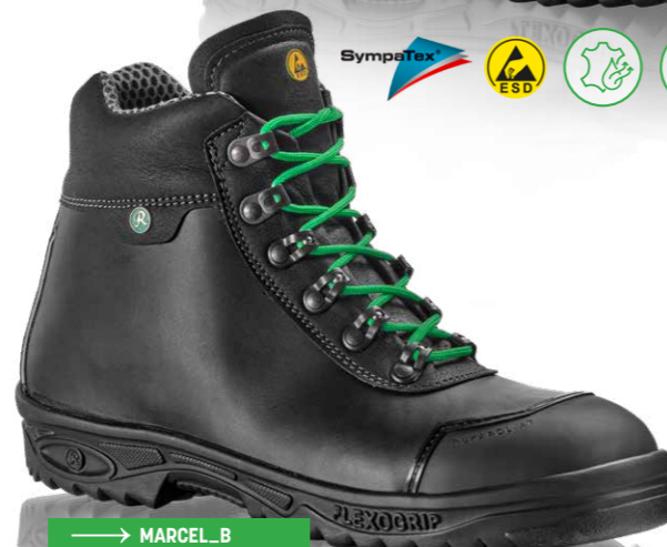
→ MARCEL_B ART.-NR.: s5800b331448100

EN ISO 20345:2011 S3 HI/CI SRC Gr.: 36-46