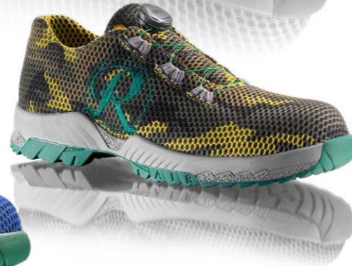
→ SPACE_AIR KOBALT ART.-NR.: s1445c426148100