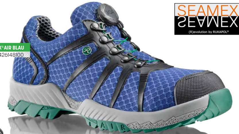
→ SEAMEX® AIR BLAU ART.-NR.: s1460f426148100

EN ISO 20345:2011 SIP HI/CI SRC GR.: 35-47