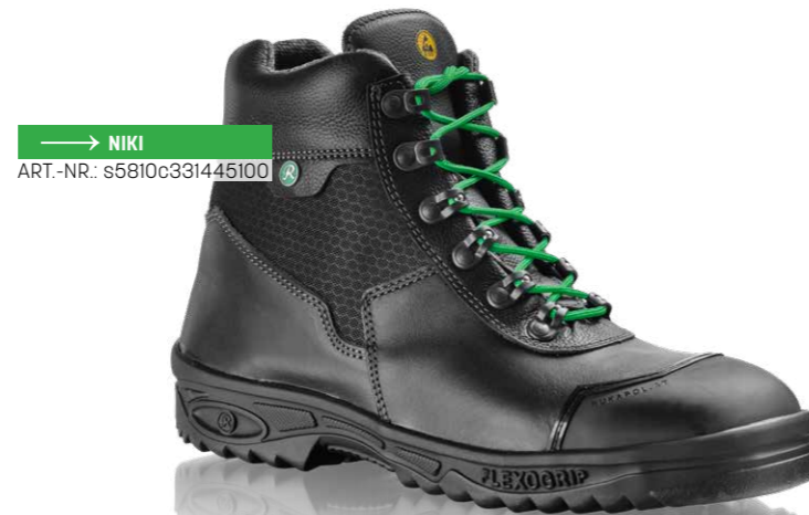
→ NIKI ART.-NR.: s5810c331445100