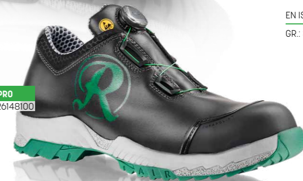
→ BOB M2 PRO ART.-NR.: s1440i426148100

EN ISO 20345:2011 S3 HI/CI SRC GR.: 38-47