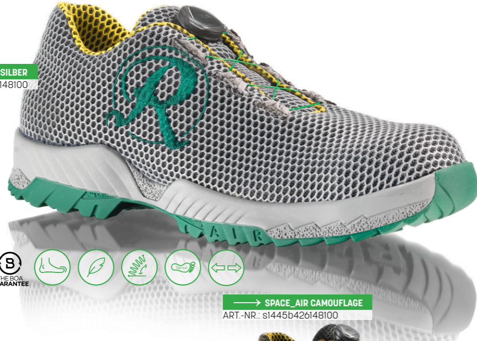
→ SPACE_AIR SILBER ART.-NR.: s1445a426148100