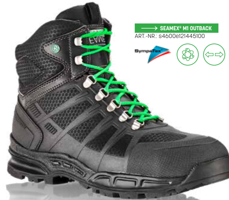
→ SEAMEX® M1 OUTBACK ART.-NR.: s4600e121445100