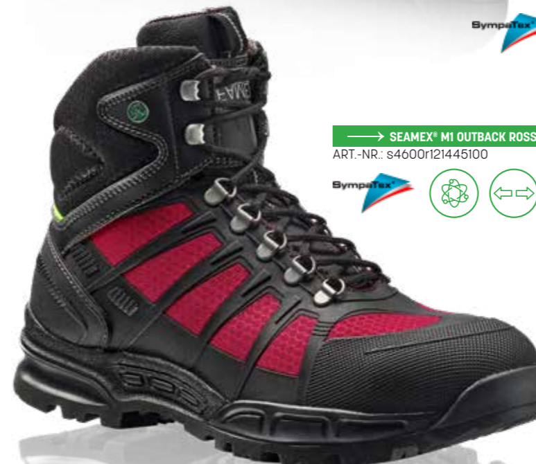
→ SEAMEX® M1 OUTBACK ROSSO ART.-NR.: s4600r121445100