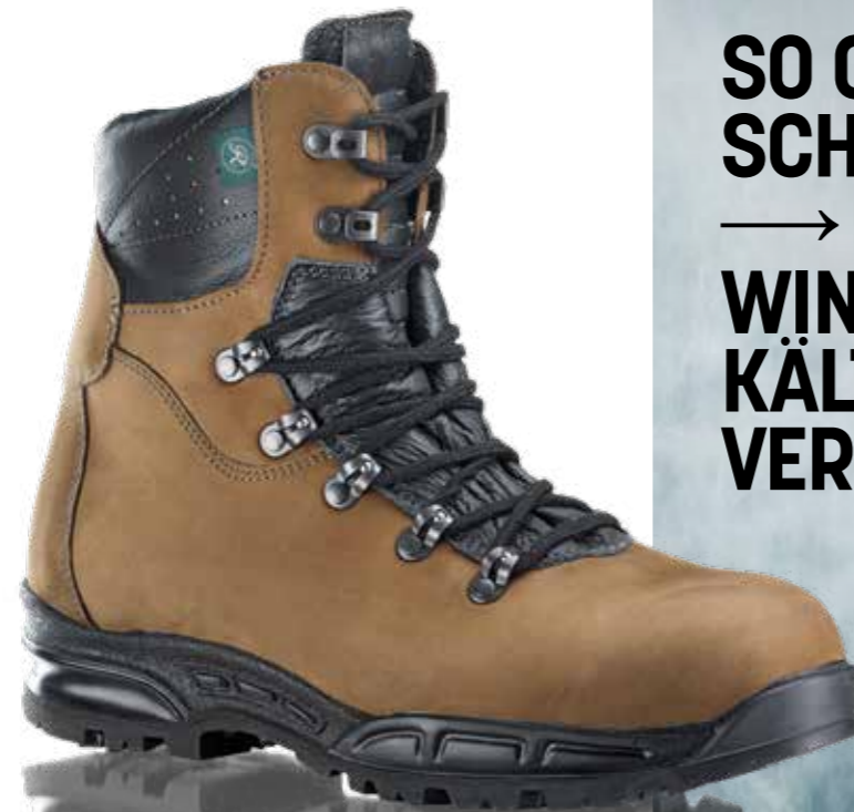
→ WILDER KAISER ART.-NR.: s6200b126449200