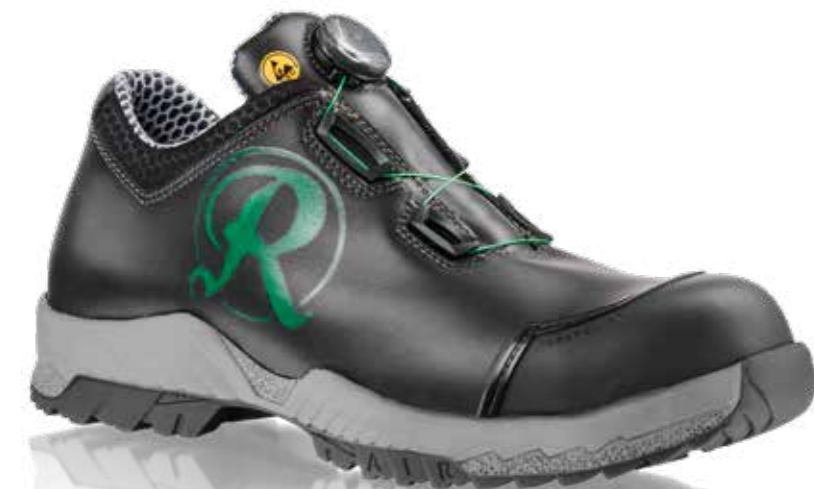
→ BOB M2 PRO ART.-NR.: s1440i426i48100

SITZT KOMFORTABEL AM FUSS → UND VERLIERT NIE DIE BODENHAFTUNG.