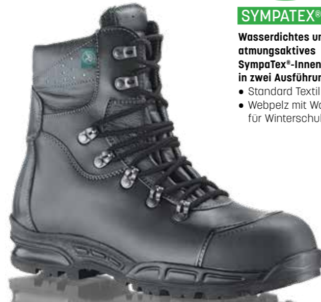
→ HOCHKÖNIG ART.-NR.: s6200a126445200