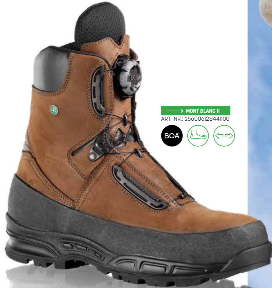
→ MONT BLANC II ART.-NR.: s5600c128441100