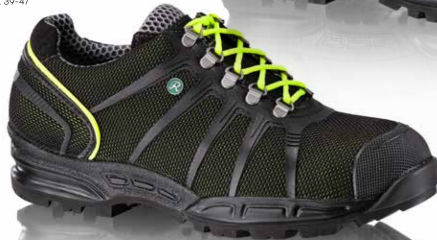
→ SEAMEX® M2 CAT EYE ART.-NR.: s1460i121148100