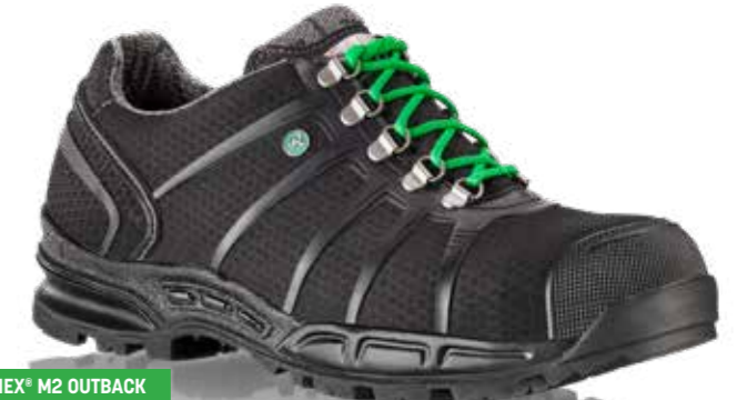
→ SEAMEX® M2 OUTBACK ART.-NR.: s1460e121145100