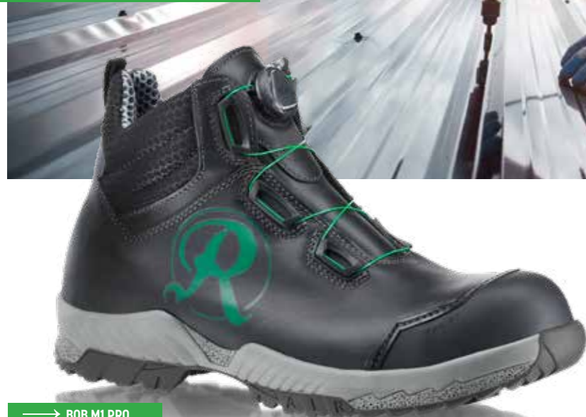
→ BOB M1 PRO ART.-NR.: s0431i426i48100