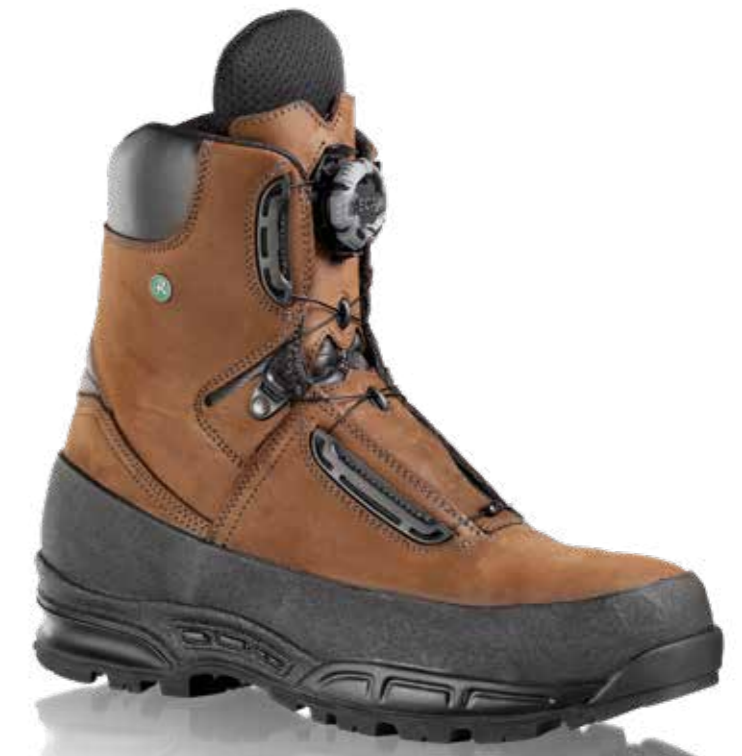
→ MONT BLANC ART.-NR.: s5600b128446200