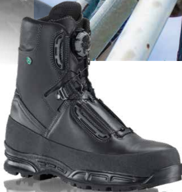
→ K II_BLACK ART.-NR.: s5600a128441100