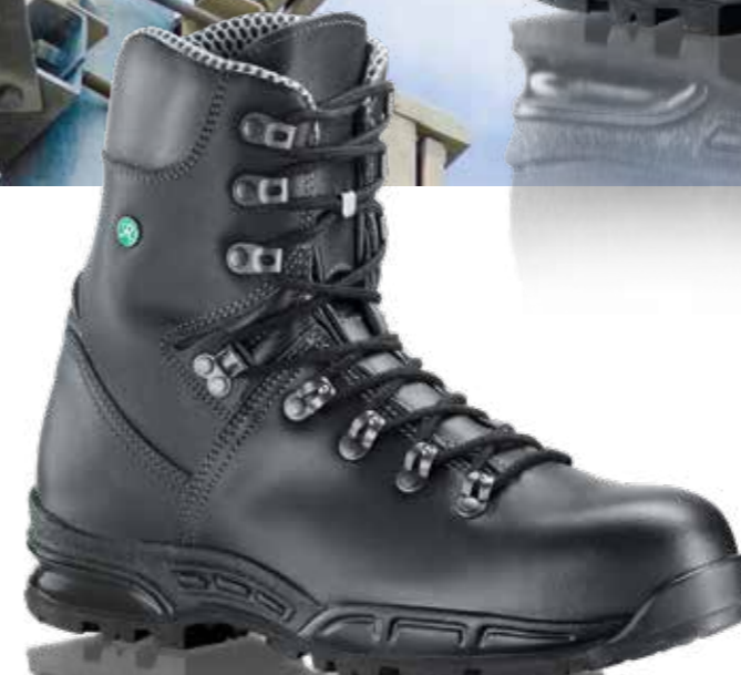
→ KL. PRIEL ART.-NR.: s5700a126448100