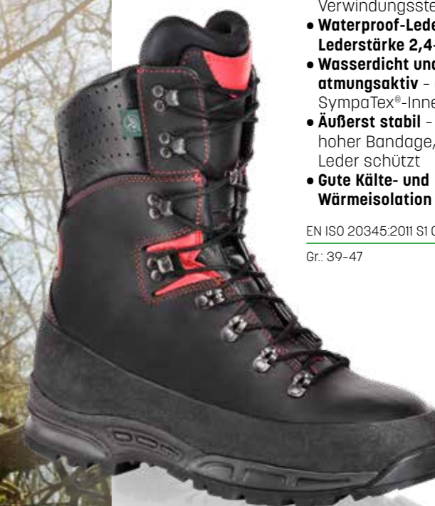
→ PIZ BUIN ART.-NR.: s6700b122445100