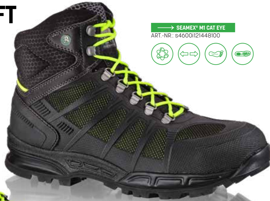
→ SEAMEX® M1 CAT EYE ART.-NR.: s4600i121448100