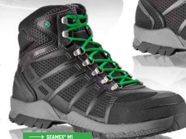
→ SEAMEX® M1 ART.-NR.: s4600b426448100