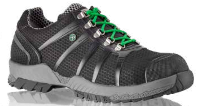
→ SEAMEX® M2 ART.-NR.: s1460b426148100