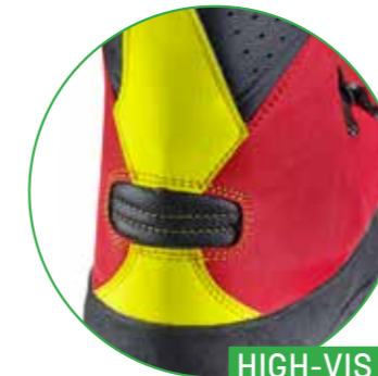
HIGH-VIS SICHERHEITS- FERSENAPPLIKATION